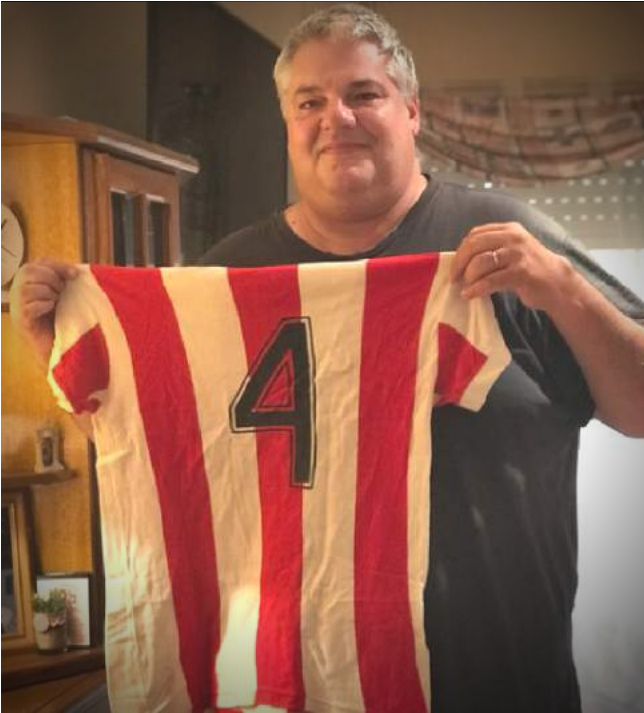
SU PRECIADA RELIQUIA: LA 4 DE GISMONDI

De todas formas, con ver el Club como está hoy soy feliz. Siempre hay algo nuevo, siempre para mejorar. En definitiva las obras son las que quedan y es lo importante