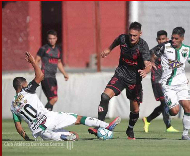
Club Atlético Barracas Central