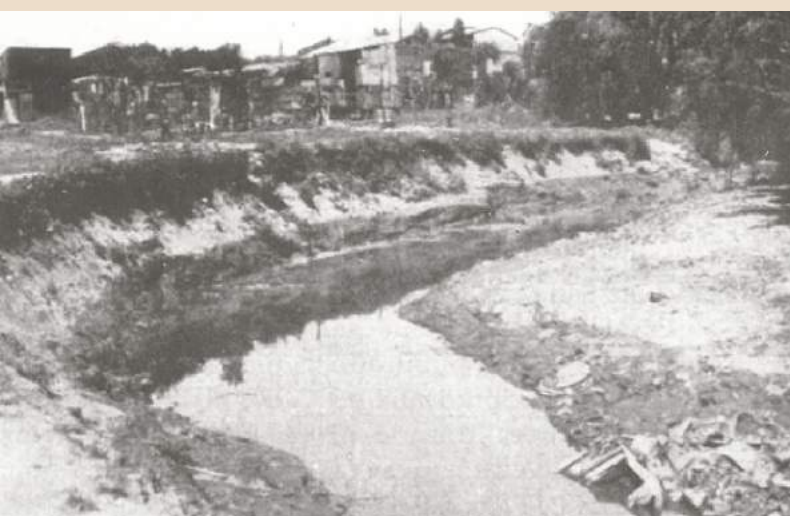
LA FACHADA DE NUESTRO BARRIO POR AQUELLOS AÑOS, CON EL CARACTERÍSTICO ARROYO QUE HABÍA QUE CRUZAR PARA LLEGAR AL ESTADIO POR OLAVARRÍA