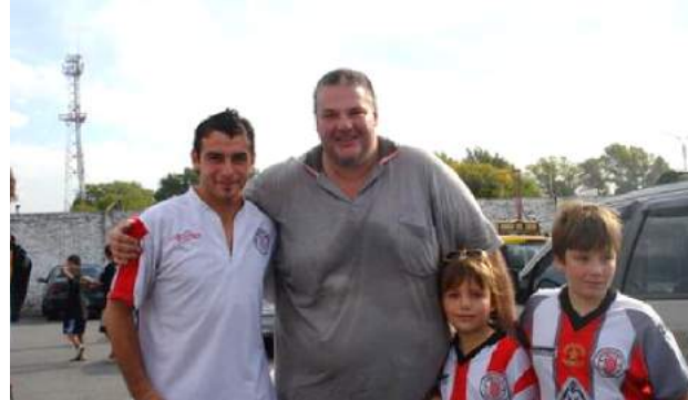
LA FOTO CON EL ÍDOLO CARLOS SALOM