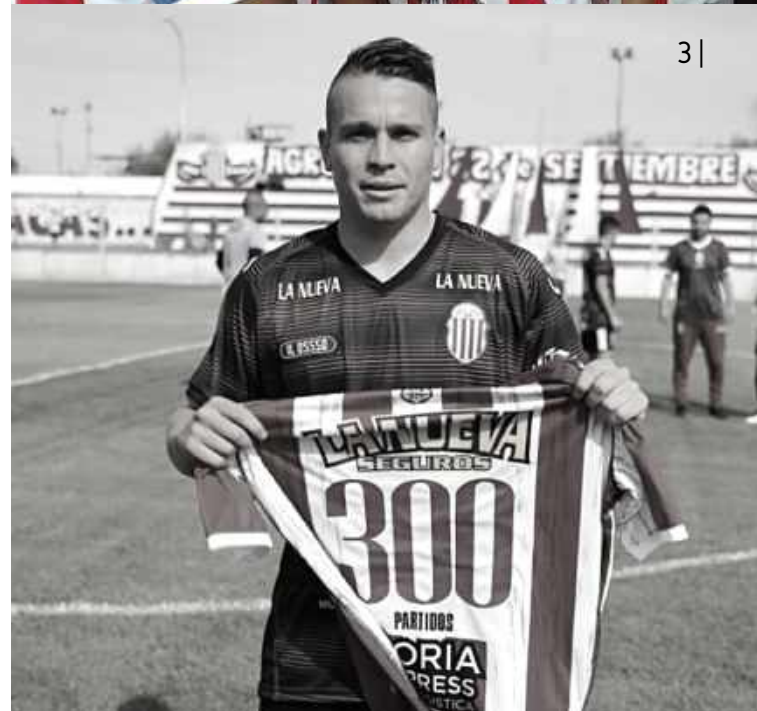
1 | Sus inicios en Huracán 2 | Debut en Primera en Barracas 3 | 300 partidos en Central