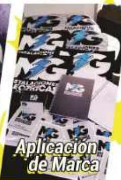
Aplicación de Marca