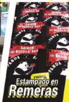
Estampado en Remeras