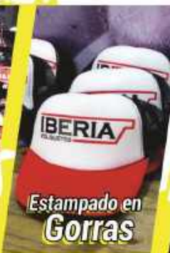
Estampado en Gorras